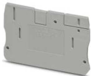
Pokrywa zamykająca, długość: 57,7 mm, szerokość: 2,2 mm, wysokość: 36 mm, kolor: szary

Należy pamiętać, że podane dane pochodzą z katalogu online. Proszę o pobranie kompletnych informacji i danych z dokumentacji użytkownika. Obowiązują ogólne warunki użytkowania dla materiałów pobieranych przez Internet. ( http://phoenixcontact.pl/download )